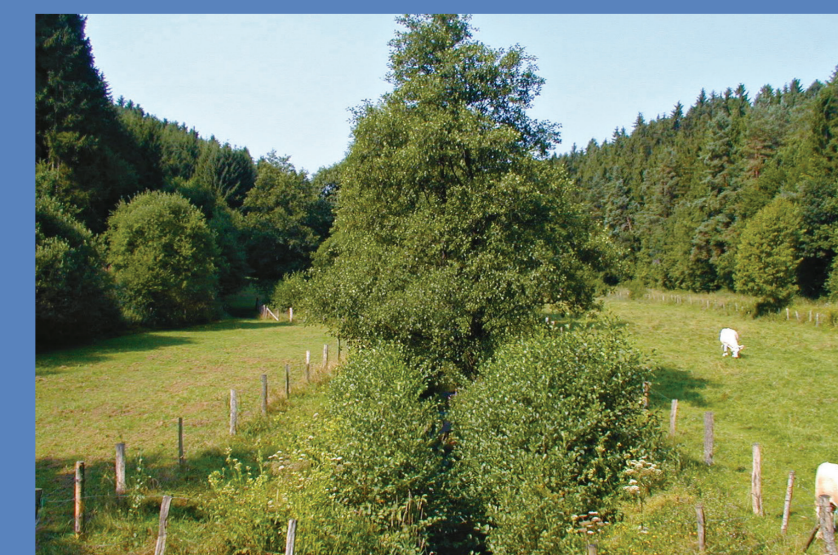
Ausgezäunte Gewässerrandstreifen sorgen für den Schutz des Ufers.