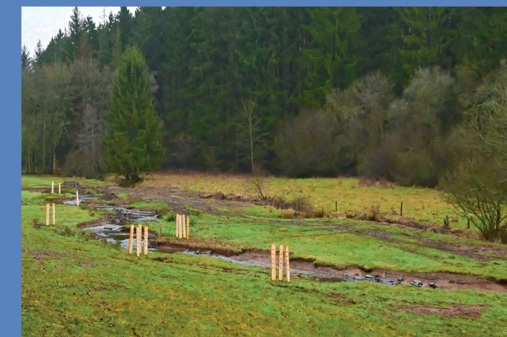
Nach Renaturierung: ein mäandrierender Bach mit mehr als verdoppelter Lauflänge.