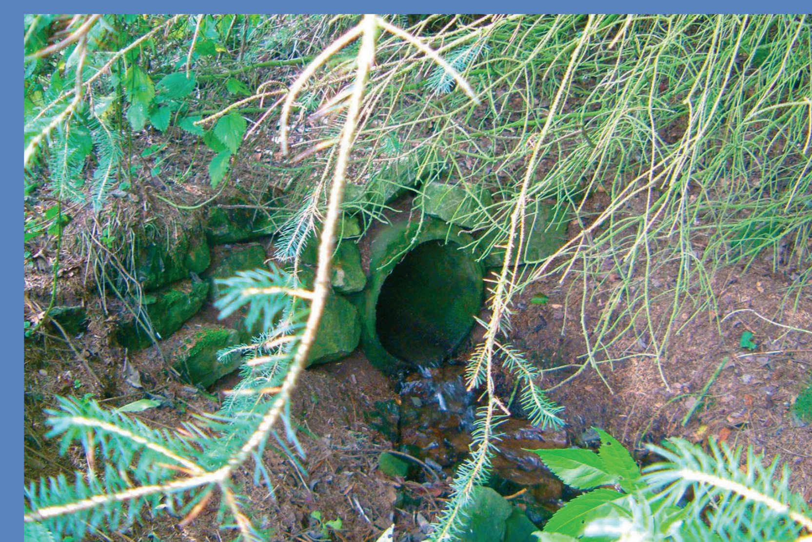
Verrohrung als Wanderbarriere, erhöhte Fließgeschwindigkeit durch engen Querschnitt und glatte Sohle.