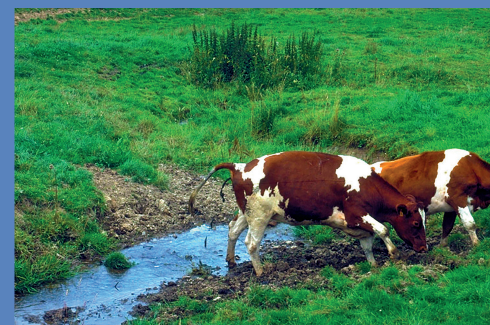
Verunreinigung des Wassers und Erosion der Bachufer durch Weidetiere.